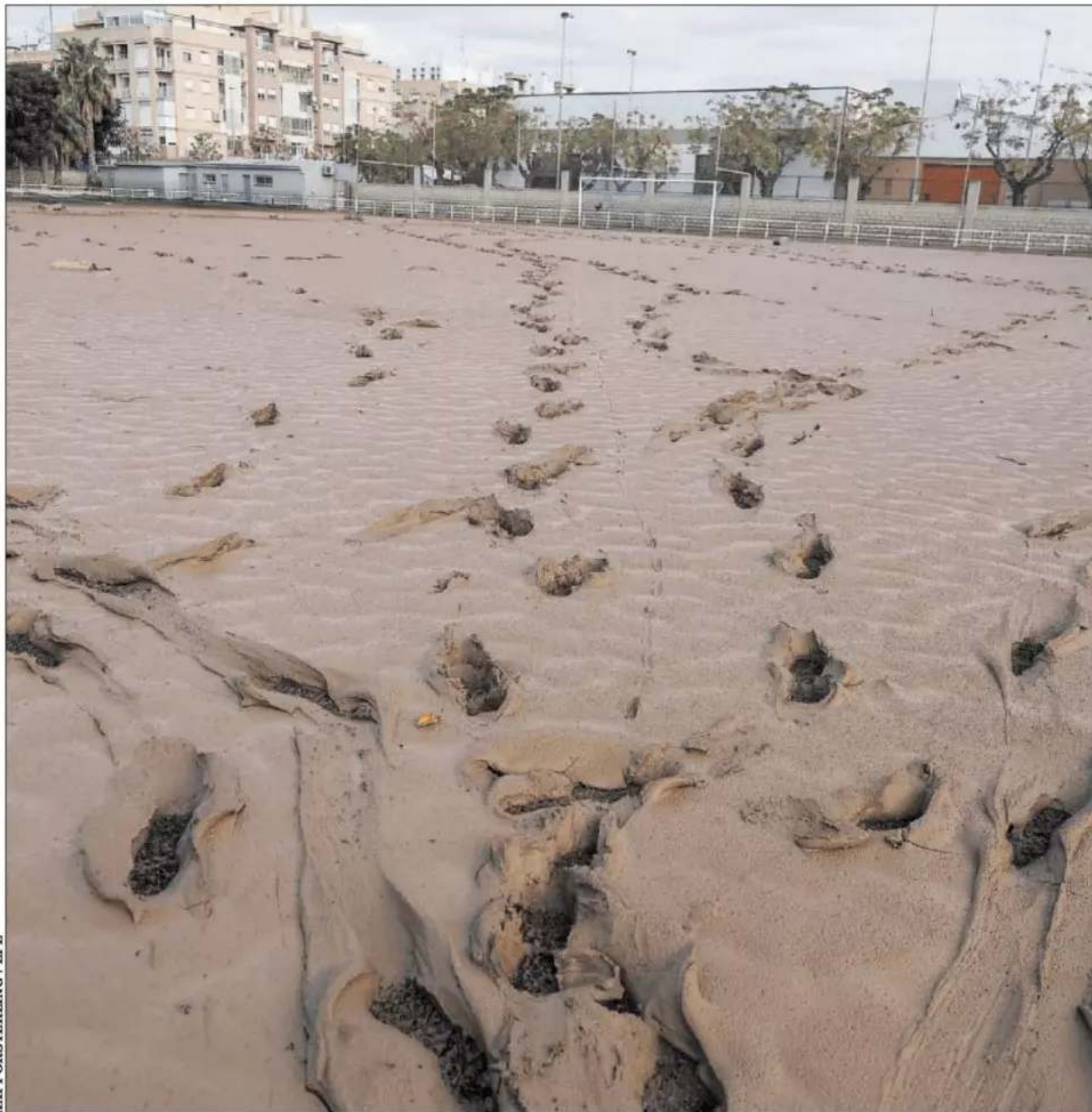
Imagen del campo de fútbol de Sedaví tras las inundaciones del 29 de octubre.