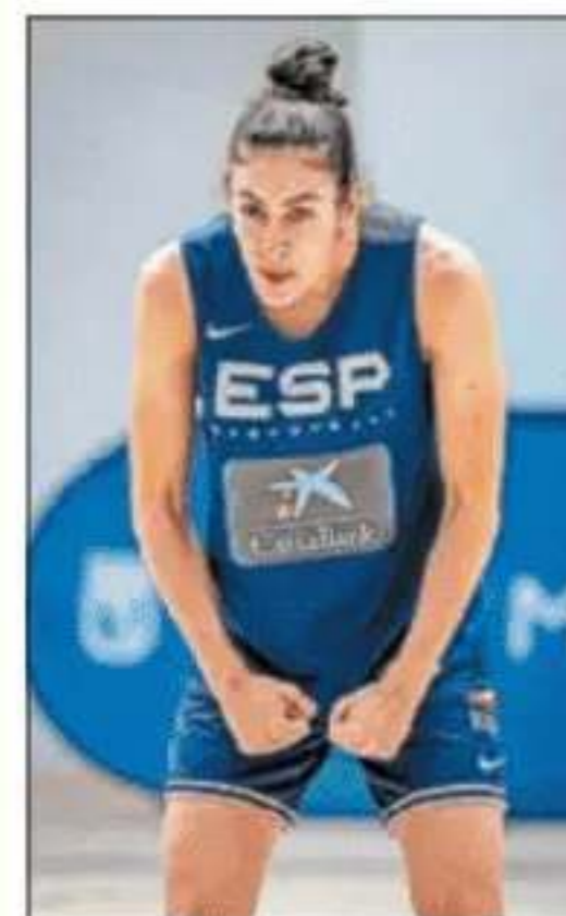
Conde, en un entrenamiento.