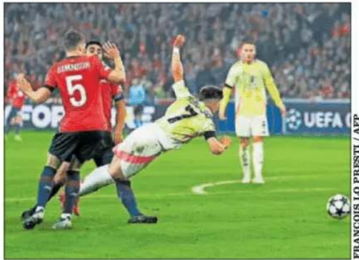
Conceição, entre Gudmundsson y André, cae derribado en el área.

de Koopmeiners. De penalti, Vlahovic puso las tablas en el marcador y sacó un empate que deja más satisfecho al Lille, el mata-gigantes de la Champions, que a los de Motta, que fueron muy superiores durante los 90 minutos.