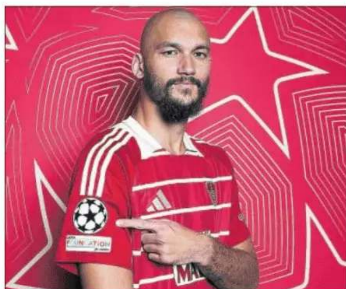
Ajourque, en una sesión fotográfica para la Champions.

■ El Brest sigue encaramado en lo alto de la tabla de la Champions, aunque su camino immaculado tiene una difícil piedra en su visita a Praga. El Sparta es un equipo muy poderoso en su estadio: solo ha perdido uno de sus últimos doce duelos en Europa. En esta edición solo ha caído en su visita al Etihad. Sima sigue lesionado en los franceses. —P. M. F