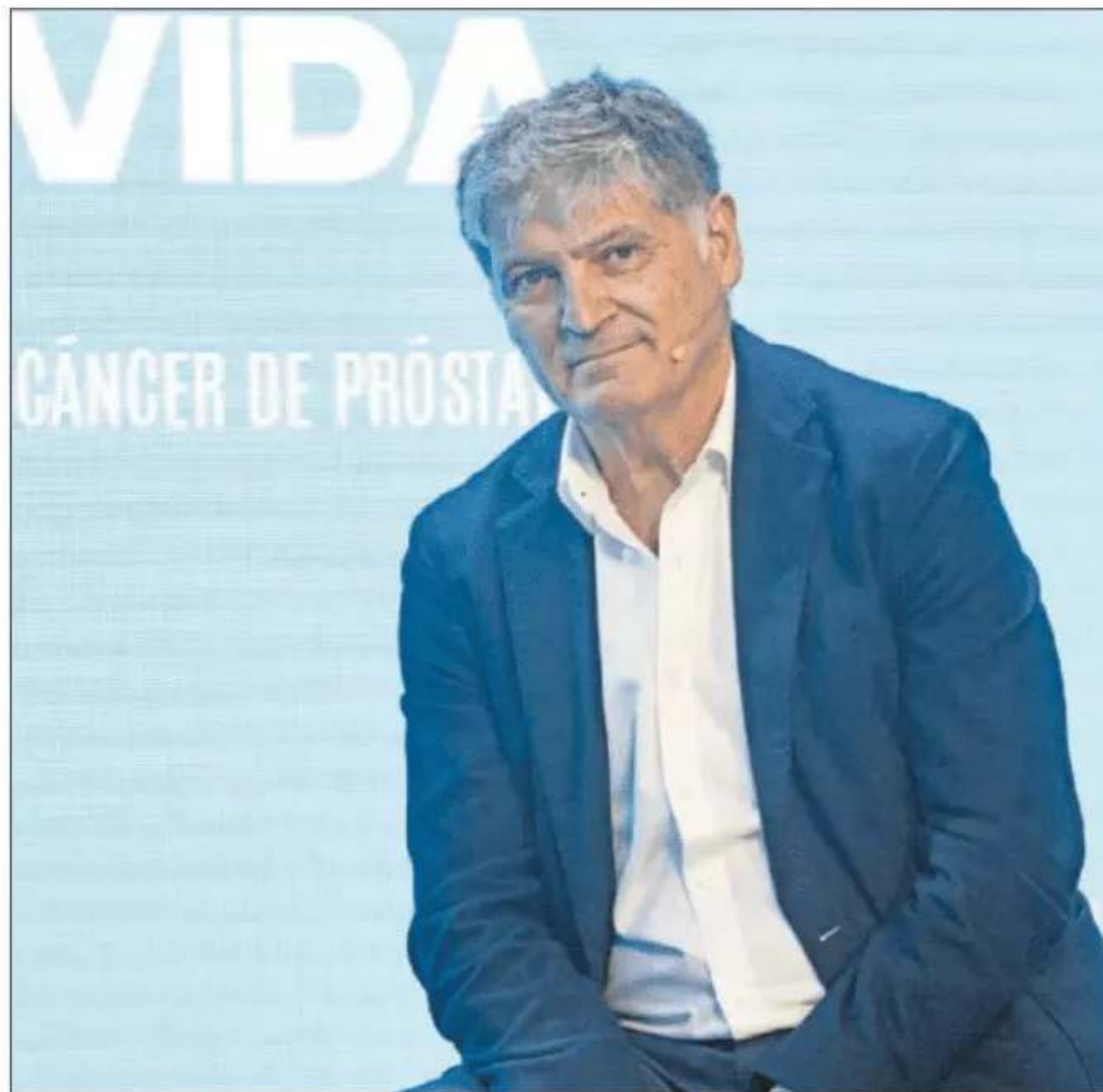
Toni Nadal posa en la presentación de la campaña 'Moviéndonos por la vida', ayer en Madrid.

Emociones "El día que envió el vídeo, la emoción saltó en toda la familia"