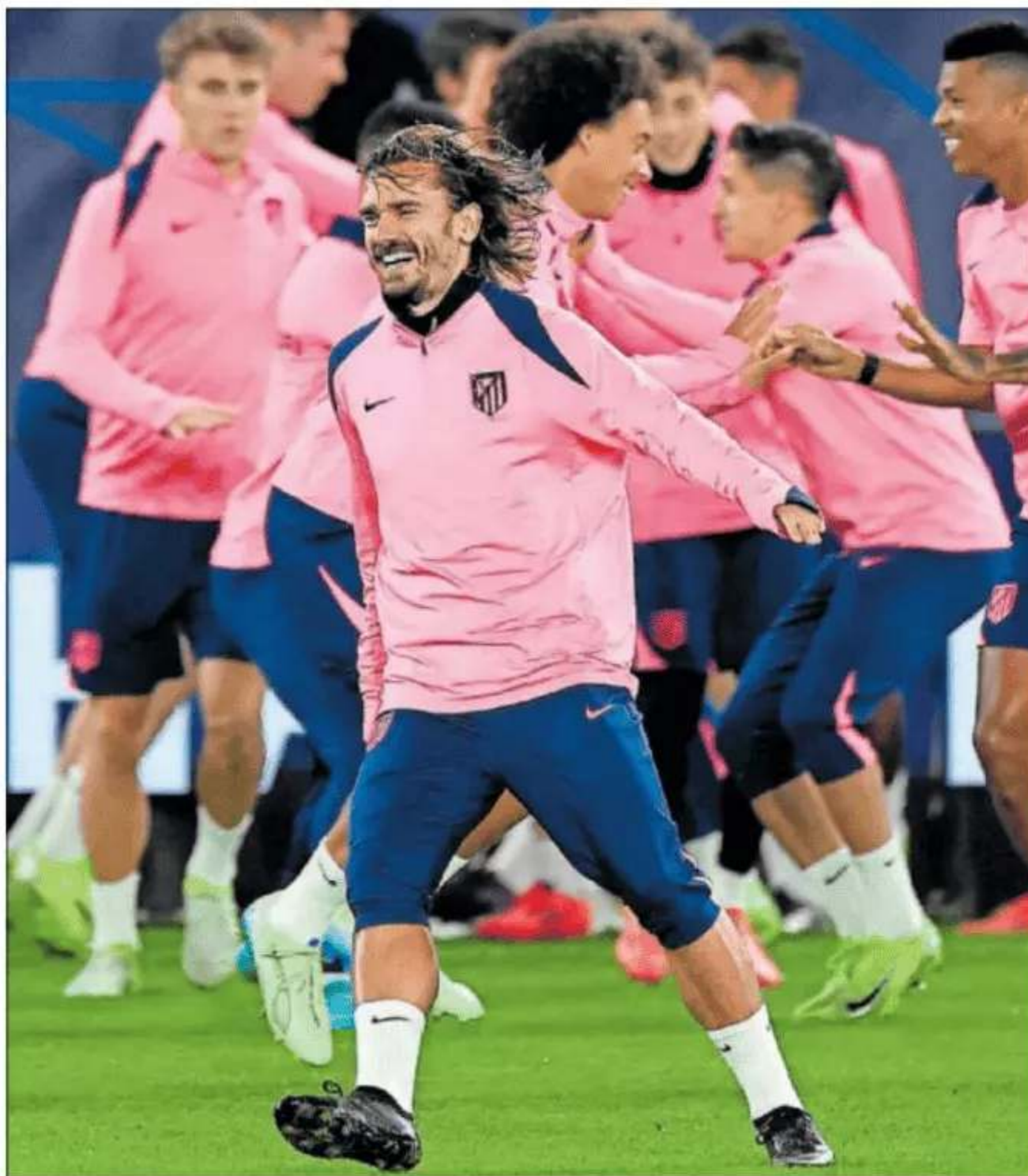
Griezmann, durante una acción ayer en la sesión del Atlético en el Parque de los Príncipes.

Cuatro años después del primer acercamiento, ya en 2020, el PSG volvió a intentar, sin