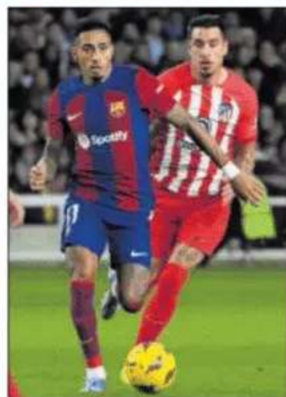
Un Barça-Atlético de Madrid.

Los seguidores barcelonistas no vacilaron en reconocer que las entradas para los dos siguientes partidos en Belgrado ya las están en reventa.