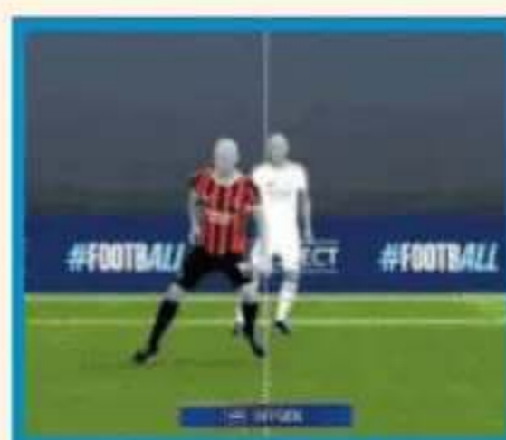
El fuera de juego de Rüdiger.

► Gol anulado a Rüdiger (81'). El que hubiera sido el 2-3 está bien anulado por el VAR. Es fuera de juego de Rüdiger porque el balón viene de una salvada del portero, no de un despeje. Cuando el balón