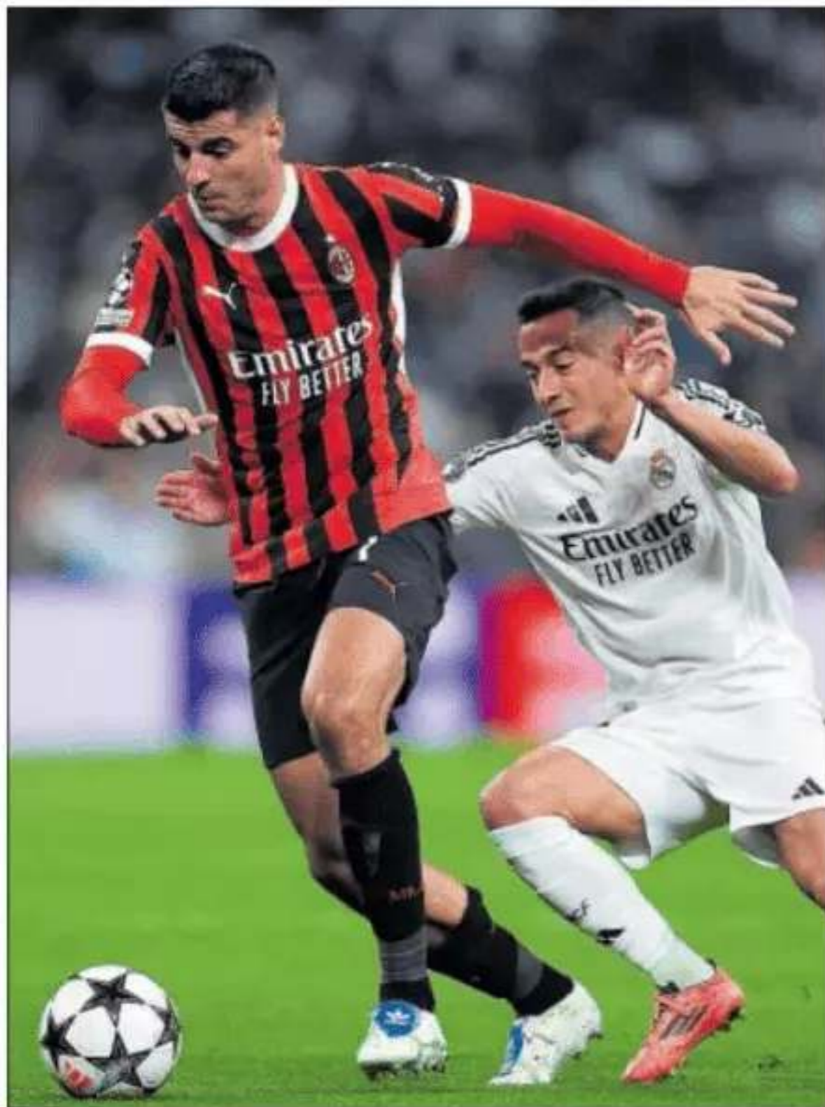
Morata se dispone a celebrar el gol del 1-2 que marcó él mismo.

■ Pintaba a noche de Morata. Y lo fue. La de su regreso al Bernabéu, ese estadio donde llegó a ser pitado llevando la camiseta de España (en el amistoso frente a Brasil, contra el racismo). Territorio comanche. La relación entre el madridismo y aquel muchacho —ya hecho a sus 32 años— que salió de su cantera está rota. Hecha pedazos. Y ninguna de las dos partes lo esconde, a estas alturas. Ya es innecesario. Lo que pocos se imaginaban en Chamartín