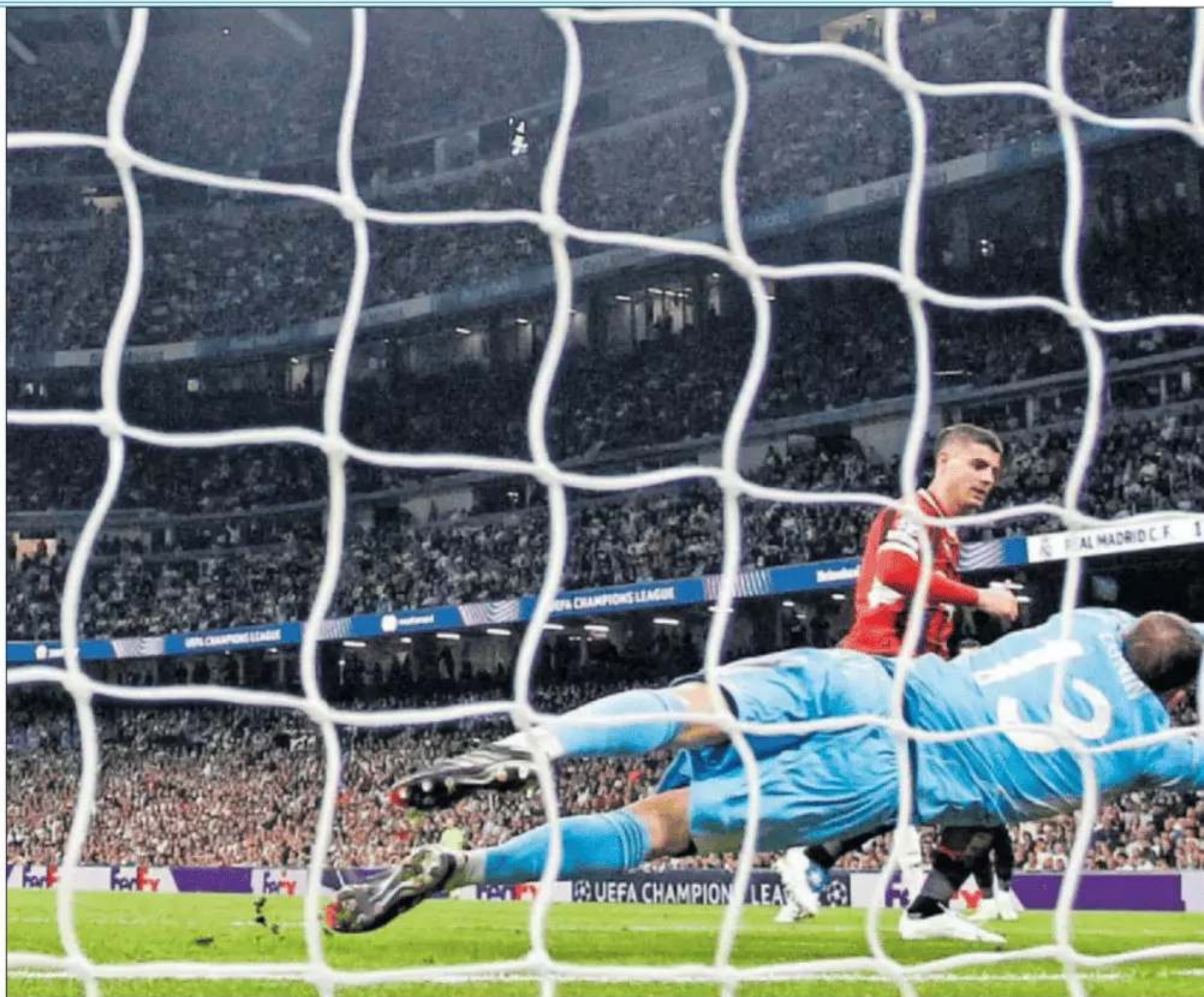
Morata marca el segundo gol del Milán al ser el primero que acudió al rechace de Lunin tras disparo de Rafael Leão.

El Madrid no perdía dos partidos seguidos en casa encajando más de tres goles en cada uno desde hace más de 15 años. Sucedió en mayo de 2009, cuando primero el Barcelona (2-6) y luego el Mallorca (1-3) se impusieron en la recta final de la Liga al equipo entonces entrenado por Juande Ramos. El Madrid ya ha sufrido más derrotas (3) en lo que va de temporada que en toda la campaña pasada (2).