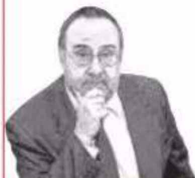
ALFREDO RELAÑO X@as_relano

Una enorme bandera de la Comunidad Valenciana se desplegó de arriba abajo por la grada de La Castellana , entre la ovación emocionada del Bernabéu . A eso siguió el minuto de emisión solemne del himno de aquella comunidad, con los jugadores en el círculo central. Un mensaje de condolencia hacia esa gente que sufre lo indecible. Sé que las opiniones en este punto están divididas, y así seguirán hasta el fin de los tiempos, pero tiendo a pensar que el fútbol puede hacer más encendido que apagado. Aunque entiendo a todos los que se han sentido desacomodados estos días, al jugar o entrenar sin ánimo para ello. *