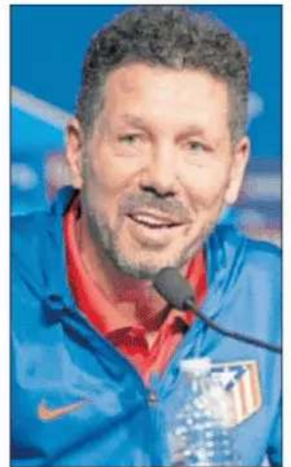
Diego Pablo Simeone.

—Del Griezmann futbolista solo tengo agradecimiento. Le conocimos cuando tenía 23 años y llegó al club, desde entonces hemos crecido juntos. Yo soy el entrenador que le puso más de 400 veces, si siento algo es admiración por su trabajo, por su forma de vivir y de interpretar su salida de la selección. Le disfrutaremos hasta que no esté con nosotros y será de los mejores futbolistas de la historia del Atlético.