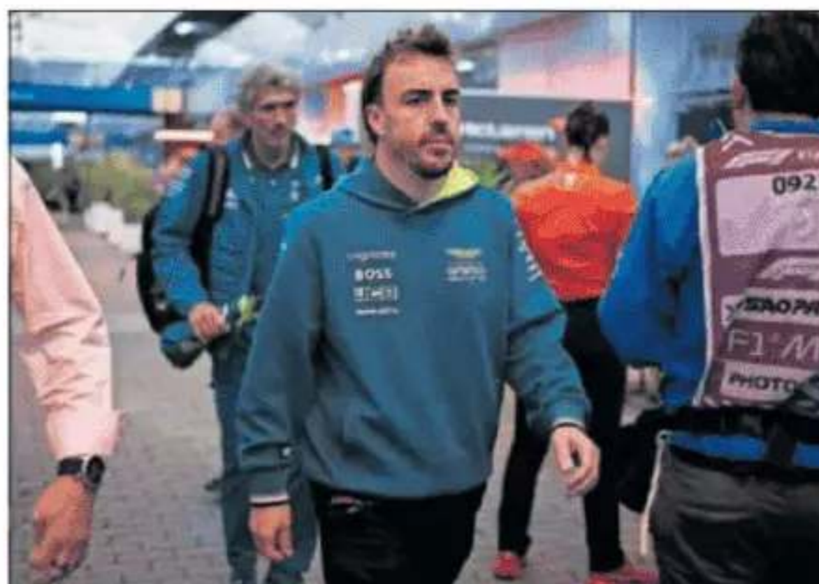
Fernando Alonso, en el 'paddock' del circuito de Interlagos.

Paso atrás. Alonso logró ocho podios con Aston Martin en 2023, fue cuarto del Mundial de pilotos y la escudería terminó quinta en el campeonato de constructores con 280 puntos. Este año ocupan la misma posición en la clasificación de equipos, pero apenas suman 86 puntos. En marzo estaban a la altura de McLaren y Mercedes, pero conforme el resto ha evolucionado, el AMR24 se ha estancado hasta convertirse en noveno o décimo coche. Fernando es noveno del Mundial sin un solo podio desde hace doce meses. Esa estadística difícilmente cambiará en las tres últimas carreras de la temporada, Las Vegas, Qatar y Abu Dabi. El crédito del gran inicio de campaña en el curso pasado se agotó hace tiempo y ahora es lógico dudar: ¿serán capaces de volver a hacer un coche completo y evolucionarlo convenientemente en la temporada 2025 antes de que Adrian Newey tome los mandos?