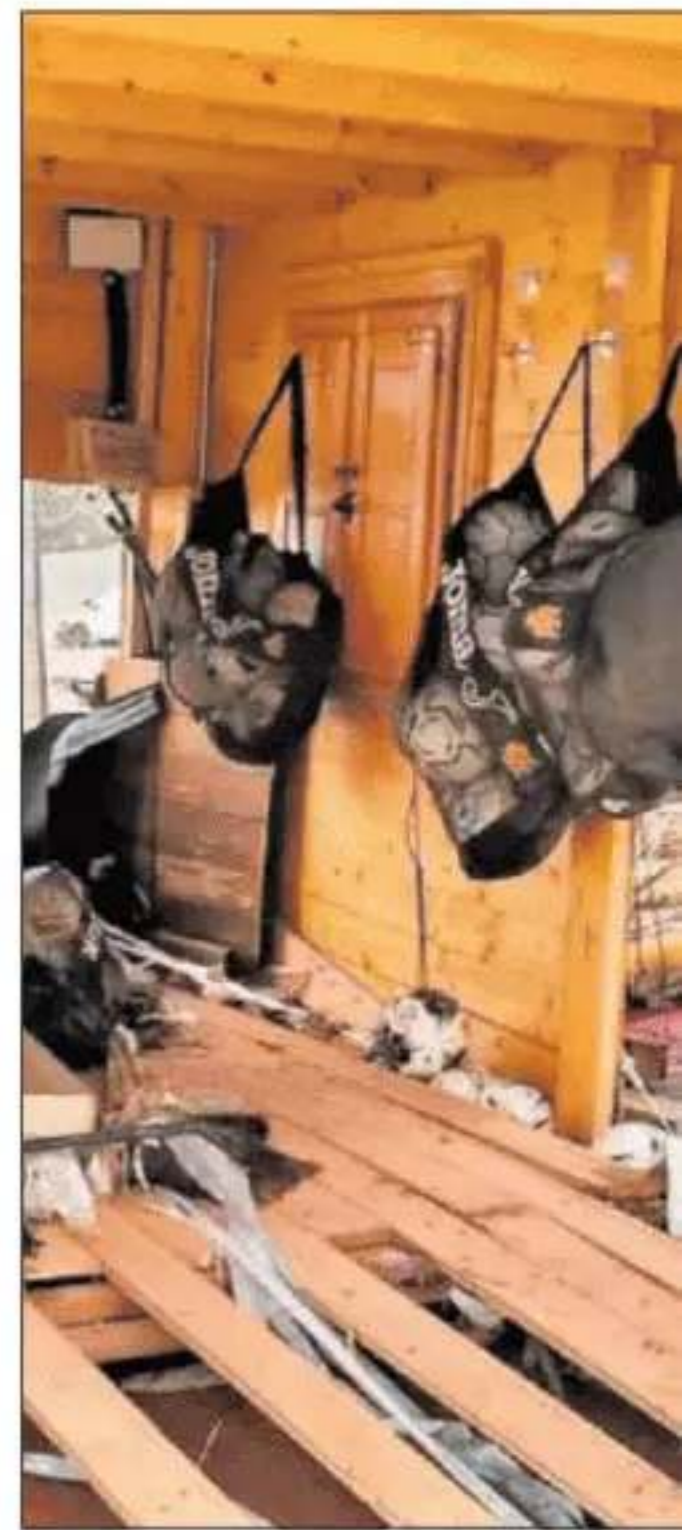
Muchos clubes han visto dañadas sus instalaciones.