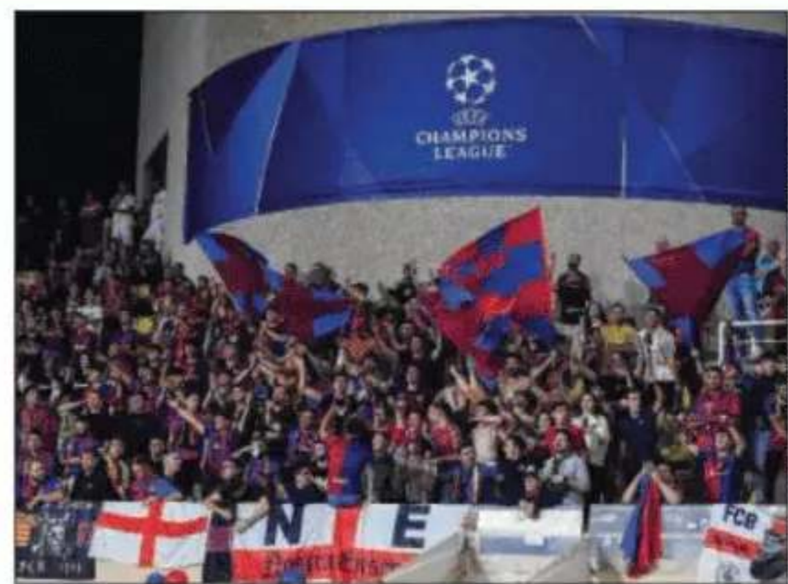
Los aficionados del Barça en Mónaco.

El cambio radical Fermín lo achaca a jugar con muchos canteranos y el trabajo de Flick