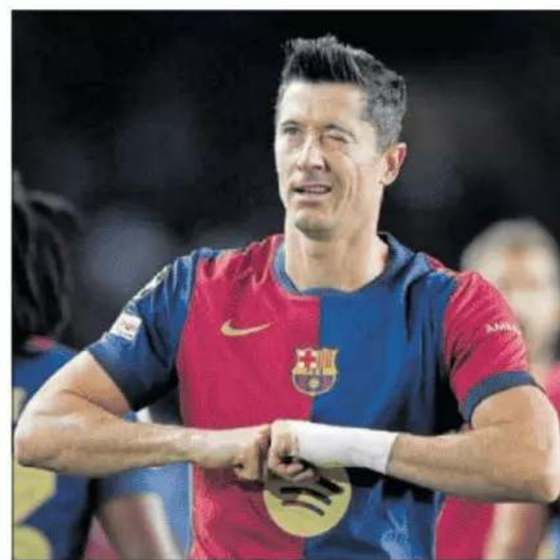
Lewandowski celebra un gol en Champions.