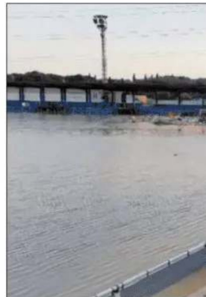
El Palleter de Paiporta, perteneciente a la RFEF.