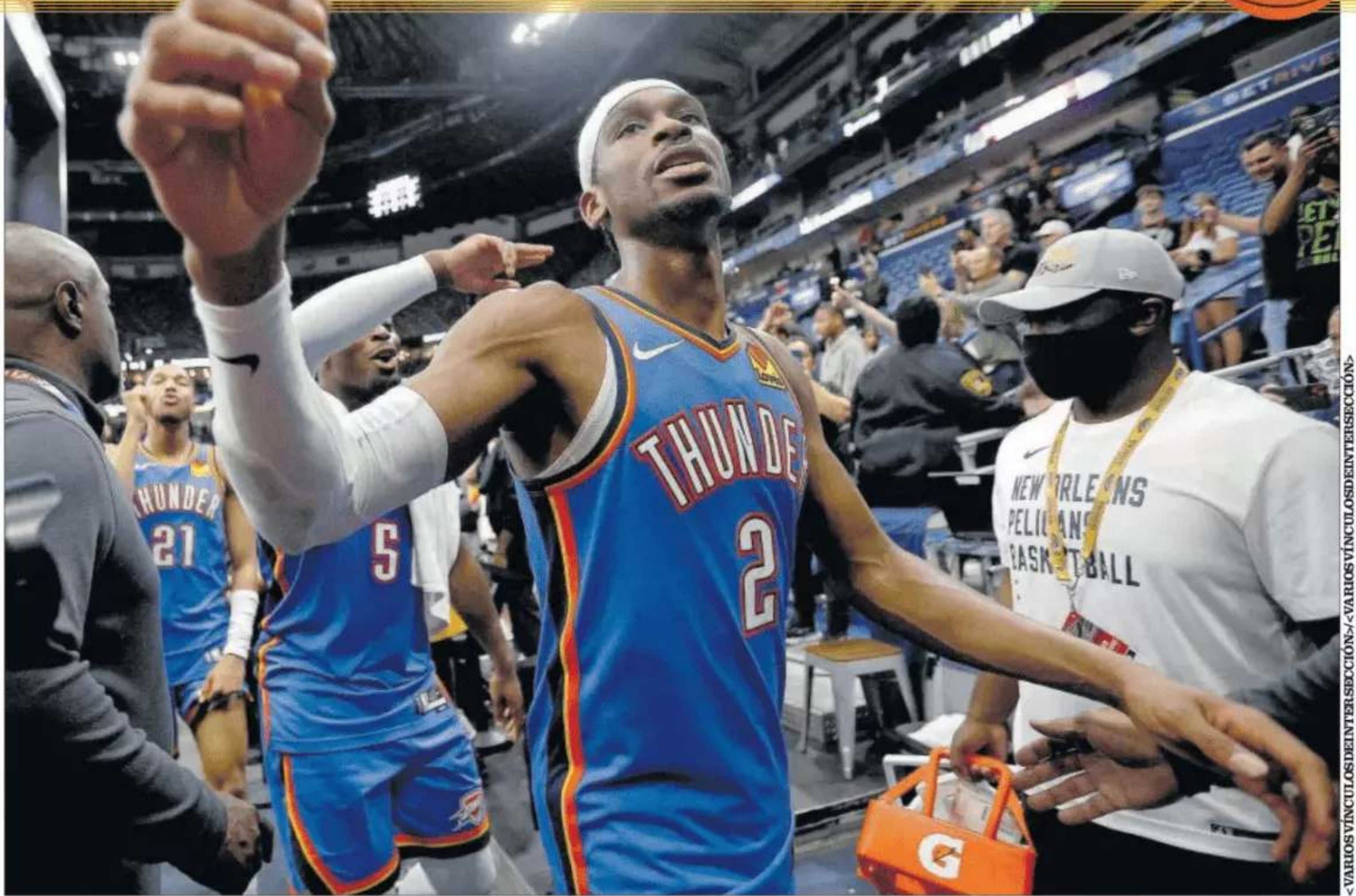
Shai Gilgeous-Alexander choca la mano de varios aficionados después de un partido de Oklahoma City Thunder.