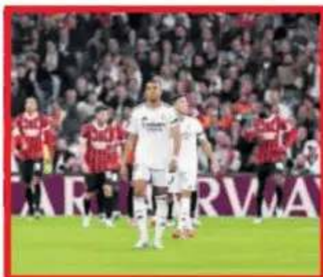
Mbappé y Lucas Vázquez, afligidos.

Una enorme bandera de la Comunidad Valenciana se desplegó de arriba abajo por la grada de La Castellana , entre la ovación emocionada del Bernabéu . A eso siguió el minuto de emisión solemne del himno de aquella comunidad, con los jugadores en el círculo central. Un mensaje de condolencia hacia esa gente que sufre lo indecible. Sé que las opiniones en este punto están divididas, y así seguirán hasta el fin de los tiempos, pero tiendo a pensar que el fútbol puede hacer más encendido que apagado. Aunque entiendo a todos los que se han sentido desacomodados estos días, al jugar o entrenar sin ánimo para ello. *