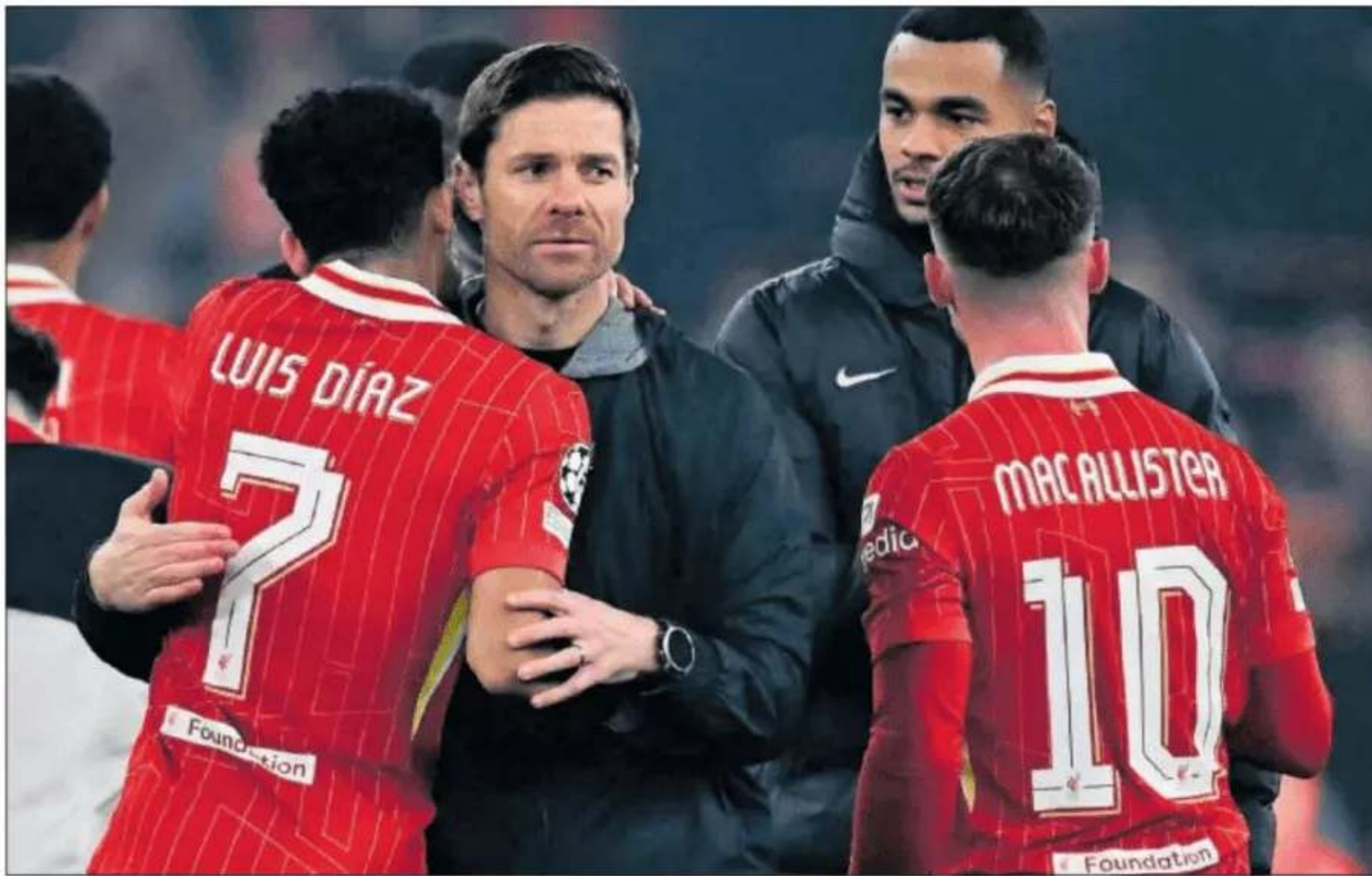
Xabi Alonso saluda a Luis Díaz tras el partido.