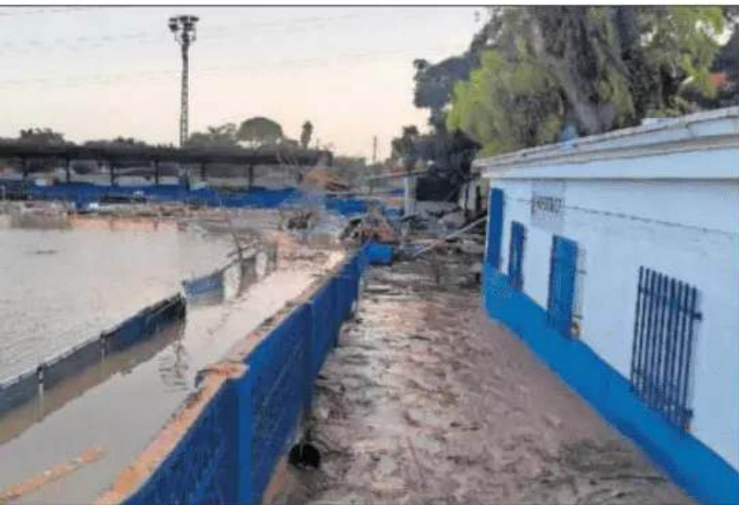
eración Española, inundado.