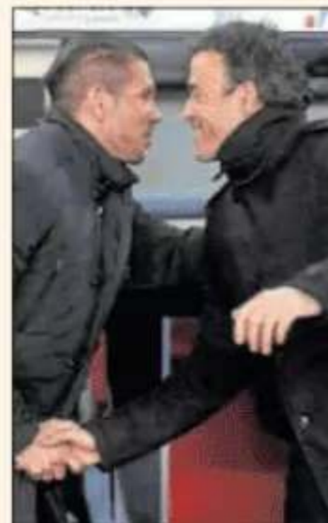
Simeone y Lucho, en 2015.

Sin embargo, como técnico azulgrana (2014-17), Luis Enrique le dio la vuelta al marcador con ayuda de Messi, Suárez, Iniesta... El asturiano venció nueve enfrentamientos de los doce y el Cholo solo le ganó uno, aunque quizá el más determinante. Barça y Atleti se cruzaron en los cuartos de la Champions 15-16, los catalanes ganaron 2-1 en el Camp Nou (con Torres, que había marcado el 0-1, expulsado a la media hora) y los madrileños remontaron la eliminatoria con un 2-0 en el Calderón, doblete de Griezmann. El Atleti ya solo pudo arañarle dos empates en el Camp Nou, uno en Liga y otro en Copa.