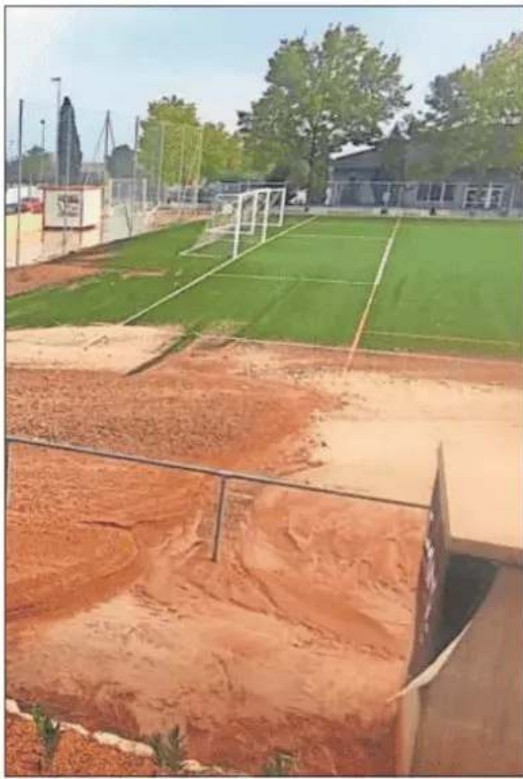
El campo de Alfafar, lleno de lodo.