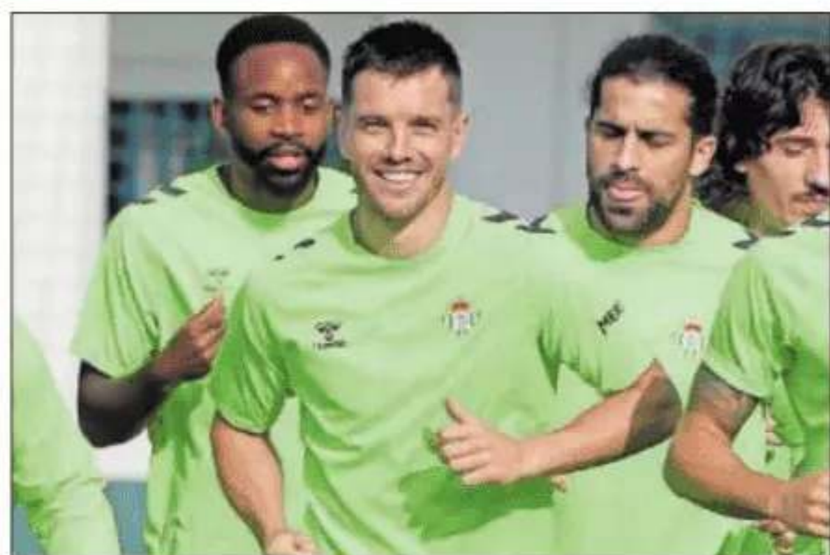
Lo Celso, durante el entrenamiento de ayer con el Betis.