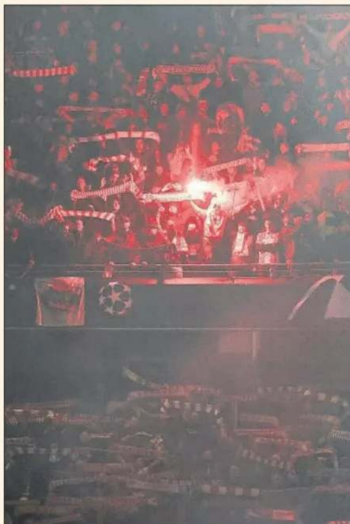
Una imagen de la grada del Pequeño Maracanã de Belgrado.

► Movimientos tras la clasificación. El campeón serbio tuvo que superar una ronda previa para jugar la fase final de la Champions y fue una eliminatoria muy dura contra el Bodo/Glimt noruego. En Escandinavia tuvo tramos en los que fue claramente sometido, pero logró anotar un tanto en el tramo final que le dio vida para la vuelta (2-1). En Belgrado se impuso por 2-0 cuajando una gran actuación: evitó que su rival desplegara el fútbol atrevido y alegre que le caracteriza, le obligó a replegarse en su propio campo y le acabó remontando por empuje, intensidad y oficio. A los pocos días, sin embargo, el club vendió al Feyenoord por siete millones de euros a uno de los héroes de la clasificación, el pivote coreano In-Beom Hwang. Lo compensó a última hora, justo antes del cierre de mercado, firmando a tres futbolistas con experiencia en ligas más potentes: el extremo del Stuttgart Silas, que llegó cedido; el medio centro bosnio ex del Milan y del Fenerbahçe Rade Krunić y el atacante del Torino y ex del Mallorca Nemanja Radonjic. Este último se lesionó a los ocho minutos de ingresar en el terreno de juego en la victoria de este último fin de semana ante la