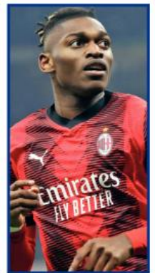
... RAFAEL LEÃO