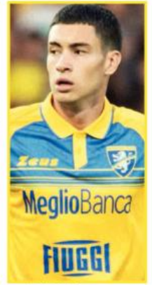
... MATIAS SOULÉ

I possibili 'uomini partita' del Milan scelti da Tu Sport