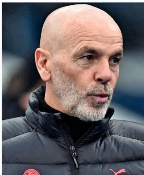
NELLE FOTO, DA SINISTRA: IL TECNICO ROSSONERO STEFANO PIOLI, IL TERZINO SINISTRO THEO HERNANDEZ E L'ESTERNO D'ATTACCO PULISIC

Frosinone e Milan tornano ad affrontarsi a distanza di due mesi dalla gara d'andata, conclusasi 3-1 per i rossoneri. La squadra di Pioli ha sfruttato al meglio le occasioni avute, punendo i giallazzurri sul finire di primo tempo con Jovic dopo che nell'azione precedente Cuni si era divorato un gol a tu per tu con Maignan.