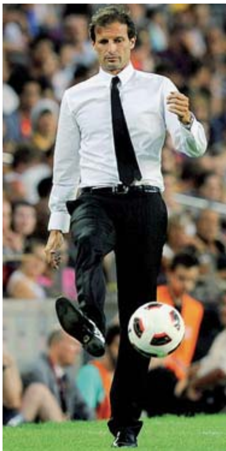
Il tecnico Massimiliano Allegri, 43 anni