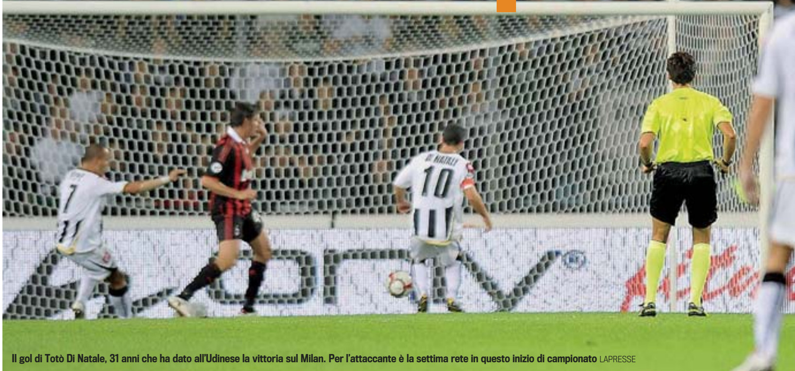
Il gol di Totò Di Natale, 31 anni che ha dato all'Udinese la vittoria sul Milan. Per l'attaccante è la settima rete in questo inizio di campionato