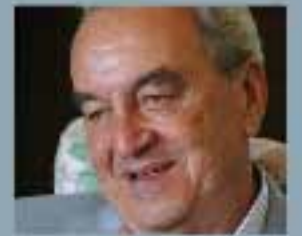
di Bruno Pizzol

Nessuno avrebbe immaginato di dover riaprire i discorsi sul capitolo scudetto. È una situazione originata sì dalla tenacia del Milan. Ma anche dal brusco rallentamento in campionato dei cugini