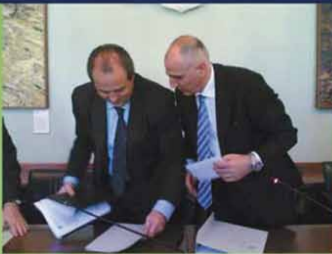
Palazzo Marino 16 aprile 2007 Conferenza stampa - Di Pietro e Grassi

"Il nostro movimento intende portare la società civile nelle istituzioni. Uomini come Grassi rappresentano la nostra ambizione di un ricambio della classe politica".