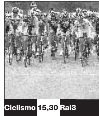
Ciclismo 15,30 Rai3