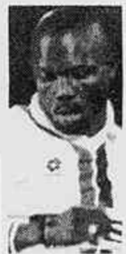
Il liberiano George Weah ha disputato l'intero incontro-clou del trofeo Rozzi ad Ascoli contro il Perugia creando le occasioni più pericolose dei rossoneri