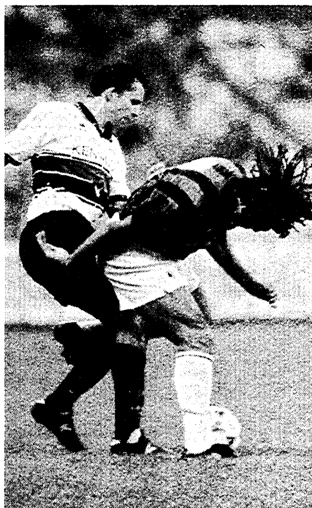
Ruud Gullit ostacolato da un difensore del Genoa