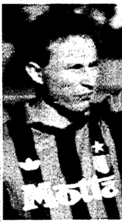
Jean Pierre Papin

tiene a scaldare la panchina. Si va avanti così da mesi. Prima si lamenta Guillit e minaccia un quarantotto, poi è il turno di Savicevic che fa scuro in volto e non parla più, ora è il turno di Papin. Non è la prima volta e non sarà nemmeno l'ultima. È il bello è che appena finito uno comincia l'altro. Tutti si aspettano da tempo il botto, l'esplosione, l'ingovernabilità dello spogliatoio. Ma quando mancano 4 secondi alla detonazione, in modo o nell'altro si trova la soluzione. La polemica si placa e il Milan continua a vincere e a giocare solo con se stesso. A proposito ieri ha firmato la 52 vittoria consecutiva e ha battuto il record assoluto del campionato a 18 squadre: 31 punti contro i 30 dell'Inter stagione '52/'53 e del Milan campionato 64/'65. □ L.C.