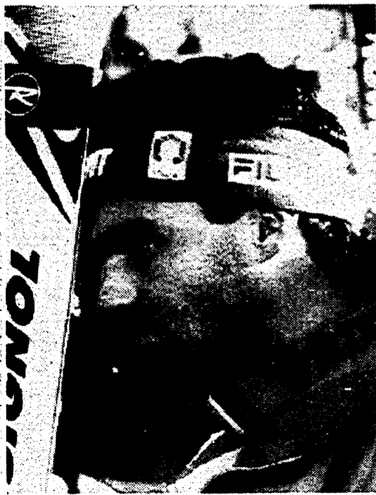
Tomba con la faccia rabbutata dopo l'ennesimo secondo posto

giocato. Un toscano vero, appunto come Aldo, non poteva resistere alla tentazione di provare a condurre i viola in Coppa Uefa, ai vertici del calcio italiano. La proposta era troppo allettante per rifiutare. Sono passati quasi venti giorni da quella dichiarazione. Venti giorni che hanno letteralmente stravolto l'Agropoli-pensiero. Dai pensieri Uefa alla folle paura di trovarsi impelagato nella lotta per la retrocessione. Dal suo ritorno in panchina, ha conquistato la miseria di un punto in tre partite: non è certo una media da Uefa. È difficile che Agropoli si sia già pentito di aver scelto la compagnia «rischiosa» dei Cecchi Gori, invece di quella più pacata e sicura di De Luca nell'«Appello dei Martedì», ma se va avanti di questo passo rischia un ritorno forzato presso la Fininvest. E chissà che il fantasista Vittorio Cecchi Gori non proponga a «Italia Uno» uno scambio alla pari: Agropoli-Falcao. Sempre per portare i viola in Uefa. □ M.C.