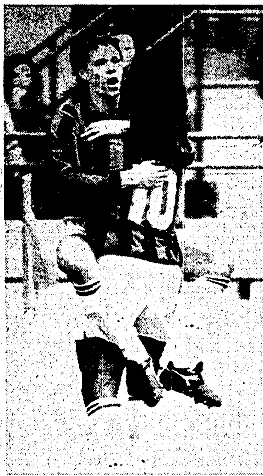
Van Basten e Gullit si abbracciano dopo il primo gol del Milan segnato dal centravanti con un preciso colpo di testa...