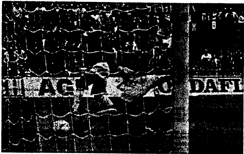
Van Basten dopo essere scattato scarta e carica la palla in rete; nella foto immagini ancora il centravanti rossoneri protagonista nell'area cagliaritanica: segnerà anche la seconda rete su rigore

Come ai vecchi tempi: avvio travolgente, pressing a tutto campo e agilità in ogni azione. Subito il gol di Van Basten nato da un errore della difesa: raddoppia l'olandese su rigore. Esce Maldini per stiramento entra Costacurta, poi si rivede Rijkaard dopo un'assenza di cinque mesi