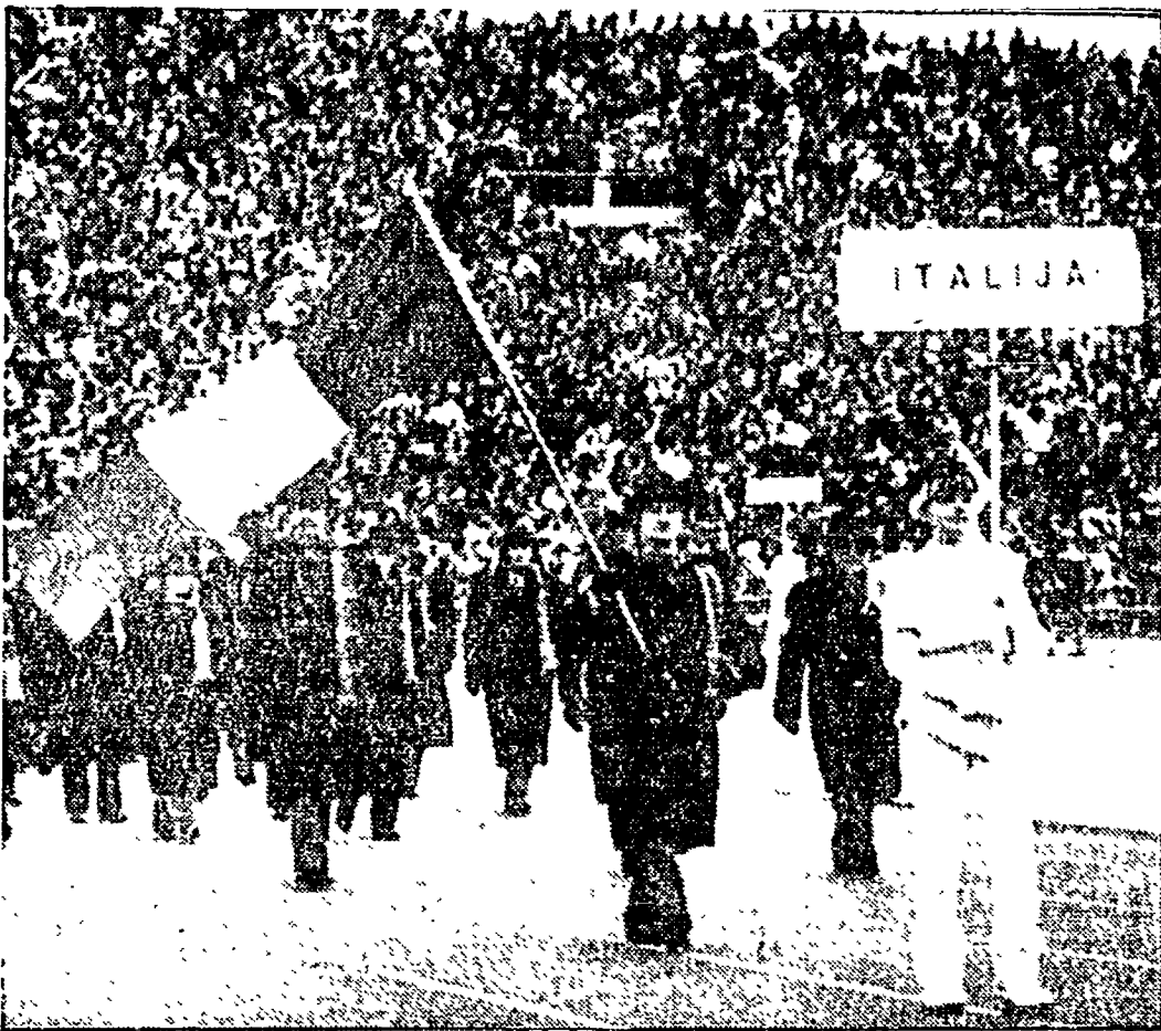
Cerimonia di apertura al Kosevo Stadium di Sarajevo: sfilà la rappresentativa azzurra