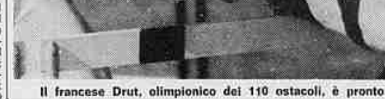
Il francese Drut, olimpionico del 110 ostacoli, è pronto a concedere la "rivincita"