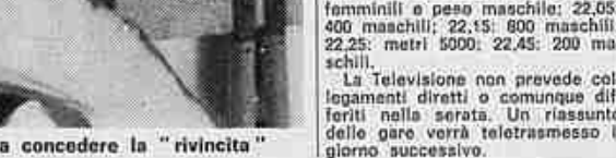
Il francese Drut, olimpionico del 110 ostacoli, è pronto a concedere la "rivincita"