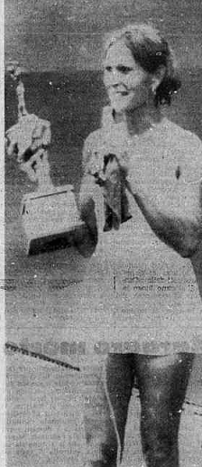
Renée Richards, ex Richard Raskind

Renée ha cambiato sesso e vuol giocare il singolare donne a Forest Hills