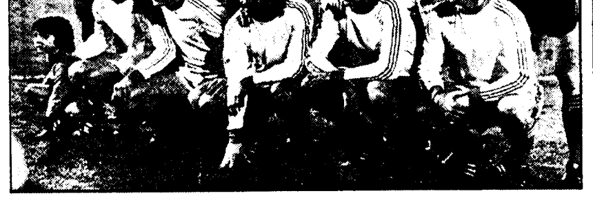
La formazione del Bruges che ha sconfitto in campionato il Mechelen per 2-0

insidie alla luce del valore degli avversari di turno. Il Bruges, allenato dall'austraco Hernst Happel che guidò gli olandesi del Feyenoord al titolo in Coppa del Campione, è in prima nella classifica del campionato belga; nelle sue file giocano cinque titolari della nazionale (le punte Lambert e Van Gool, un nome che è un programma per i centrocampisti Van Der Eycken e Cools, il difensore Leekens) che si è qualificata per i quarti del campionato europeo davanti alla Germania Orientale; pratica calcio moderno, ha saputo per i primi due turni di coppa eliminando l'Olympique Lionese e l'Ipwich grazie a formidabili prestazioni sul proprio terreno; il suo attacco ha potenziale elevato. Questi i connotati più importanti della squadra delle Fiandre, il cui obiettivo nella partita di domani è quello di mettersi al riparo, con una larga vittoria, dalle insidie del retour-