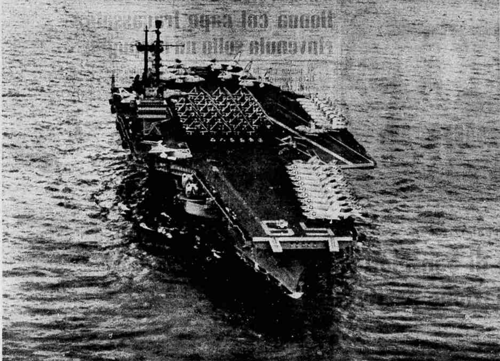
La portaerei americana «Saratoga» che ha partecipato con altre grandi unità alle manovre della Nato nel Mare del Nord, fotografata a Portsmouth

Ritorno dalle manovre navali nel Mare del Nord | 200 anni della «Cinzano»