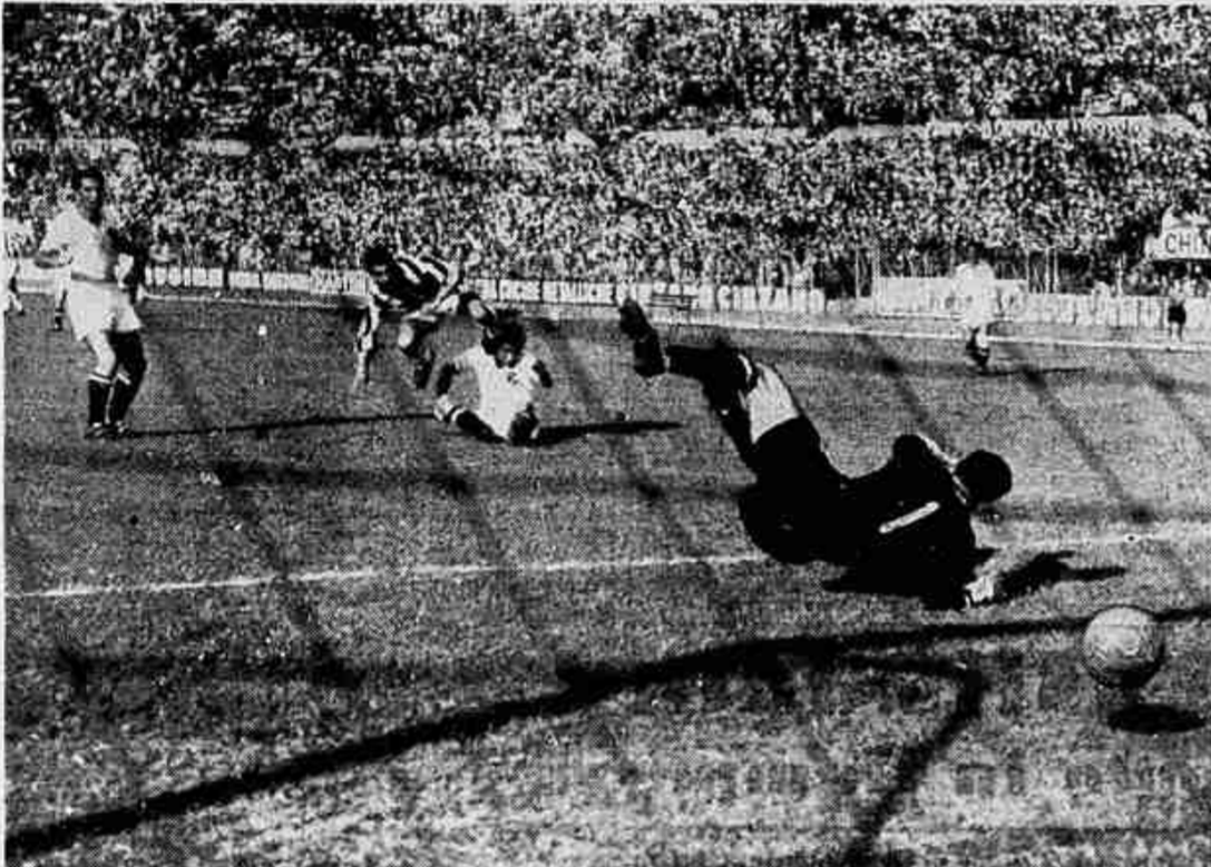
La Juventus ha faticato per piegare l'agile e scaltro squadra padovana. Ecco l'azione del secondo goal bianconero segnato dall'ala sinistra Stivanello dopo una azione personale.