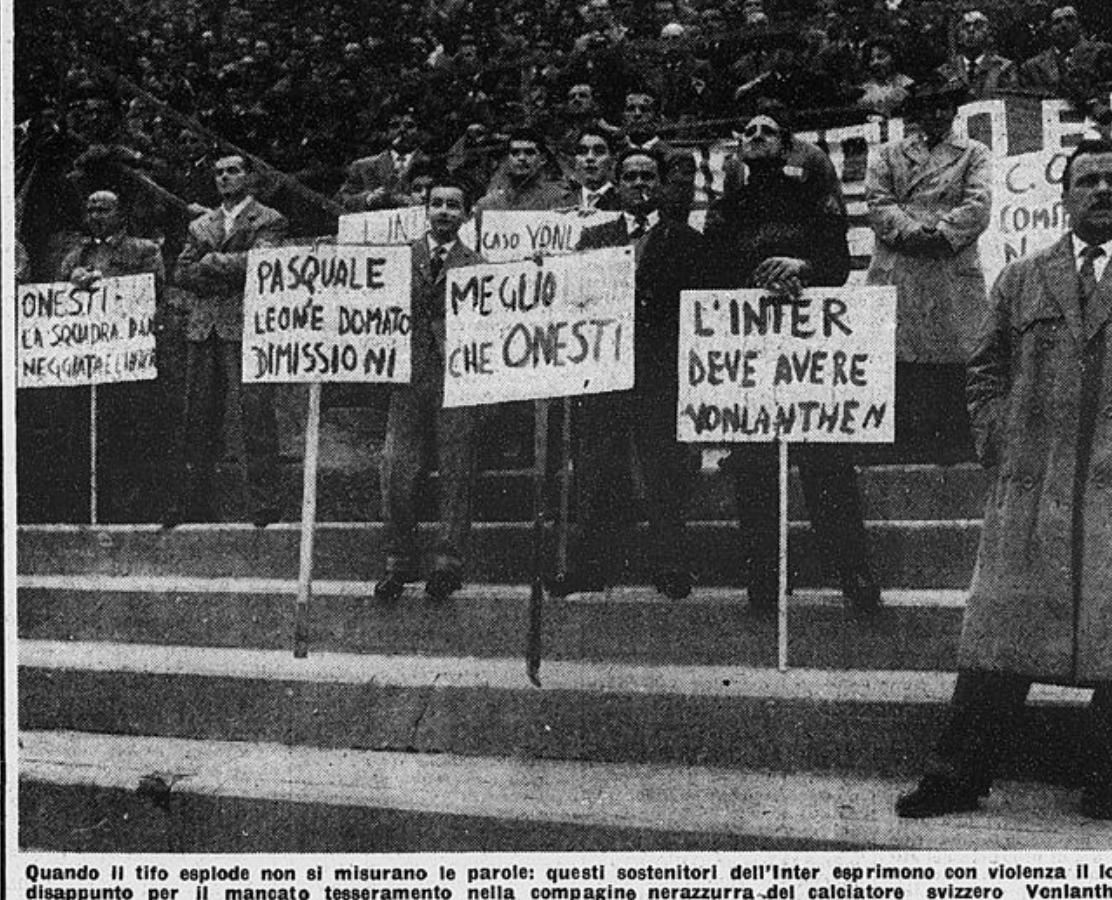
Quando il tifo esplose non si misurano le parole: questi sostenitori dell'Inter esprimono con violenza il loro disappunto per il mancato tesseramento nella compagine nerazzurra del calciatore svizzero Yonlanten