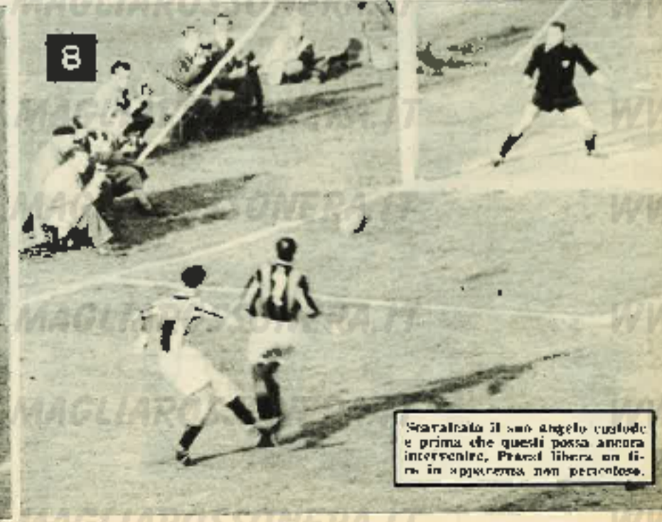
Scaricato il suo angelo custode e prima che questi possa ancora intervenire, Praest libera un filo in apparenza non pericoloso.