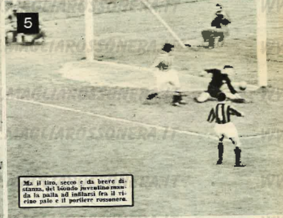
Ma il tiro, secco e da breve distanza, del biondo juventino manda la palla ad infilarsi fra il vicino palo e il portiere rossoneri.