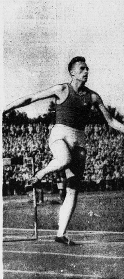
Filiput a Stoccarda ha vinto i 400 metri a ostacoli nello spettacolare tempo di 52" e 3/16.