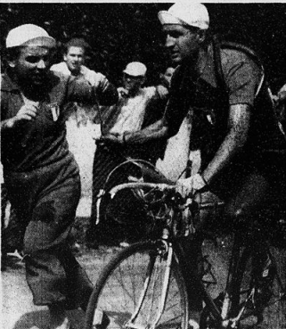
Bariali, protagonista di un superbo finale, al rifornimento volante